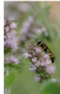
Solitärwespe an Minze