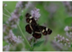
Landkärtchen auf Minze

Lässt man Küchenkräuter blühen, sind sie eine wunderbare Möglichkeit, Mensch und Tier am Gartenglück teilhaben zu lassen. Egal ob auf dem Balkon, im Pflanzkübel oder im Beet – unsere beliebten Küchenhelfer stehen auch auf dem Speiseplan von Wildbienen, Bienen, Hummeln, Schmetterlingen, Schwebfliegen und Raupen. Als Nektar- und Futterpflanzen sind blühende Küchenkräuter ein wichtiger Bestandteil einer nachhaltigen Gartenkultur und bestechen mit Duft, Farbe und Lebendigkeit! So leicht lässt sich Biodiversität fördern. Richten Sie an!