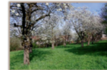
Alte Kirschwiese am Pfarrheim

Bitte Gefäße mitbringen, da die Pflanzen mit Wurzelballen, aber ohne Topf ausgegeben werden.